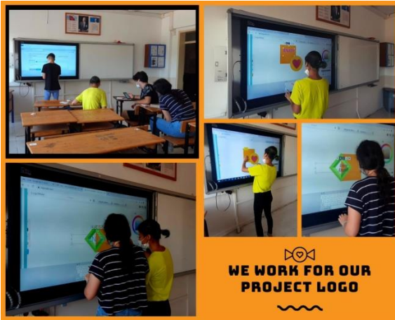
Logo hazırlık çalışmalarımız.