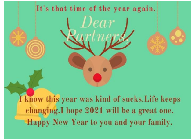
İyi dileklerimiz tüm Dünya için.